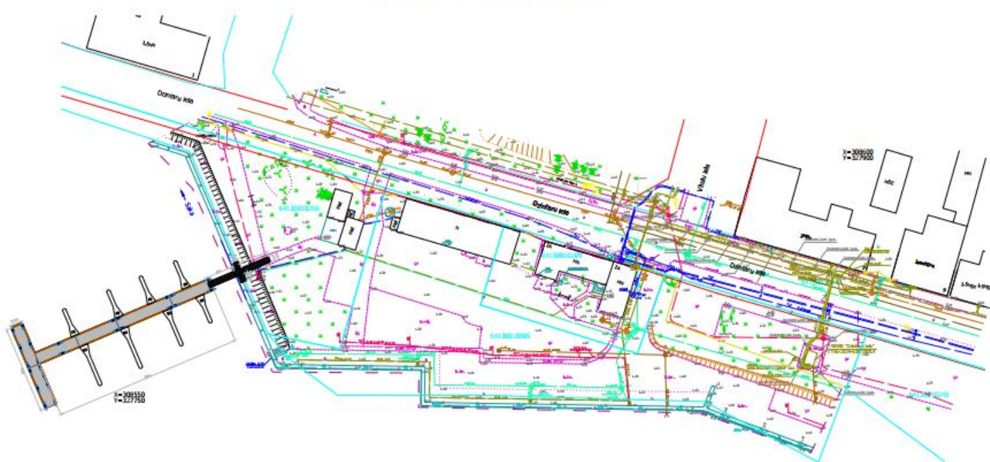
PIESTĀTĒNES NOVIETOJUMS UZ TOPOGRĀFISKĀ PLĀNA FRAGMENTA